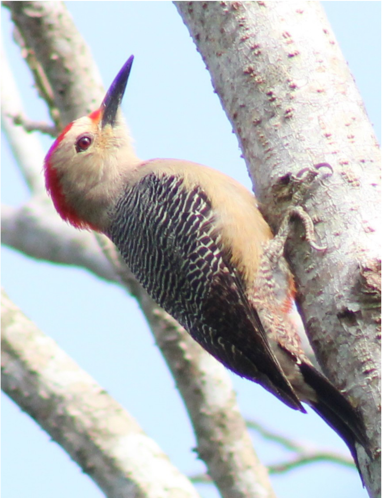
Figura 1. Individuo de Melanerpes aurifrons , carpintero frente dorada, en un árbol de cedro en el agroecosistema cacao en Tabasco, México.